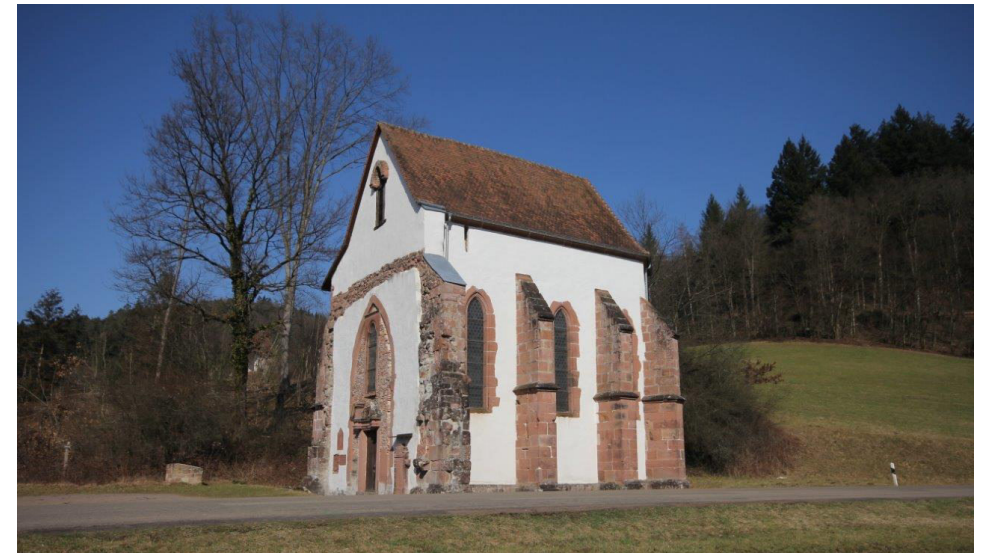
Ehemalige Zisterzienserabtei Tennenbach, 79348 Freiamt-Tennenbach

Bilder: Tennenbacher Kapelle Hans-Jürgen Günther, 2012 Text: Hans-Jürgen Günther Redaktion: Dr. Damian Slaczka