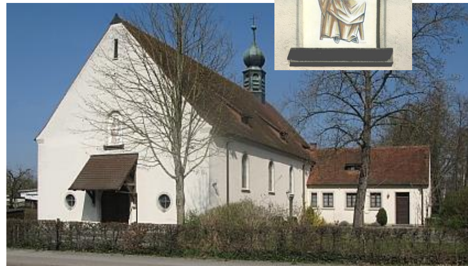
Kath. Filialkirche St. Marien , Tscheulinstr. 16, 79331 Teningen-Köndringen

Bilder: St. Marien, Dieter Arnold, 2012 Text: Dieter Arnold